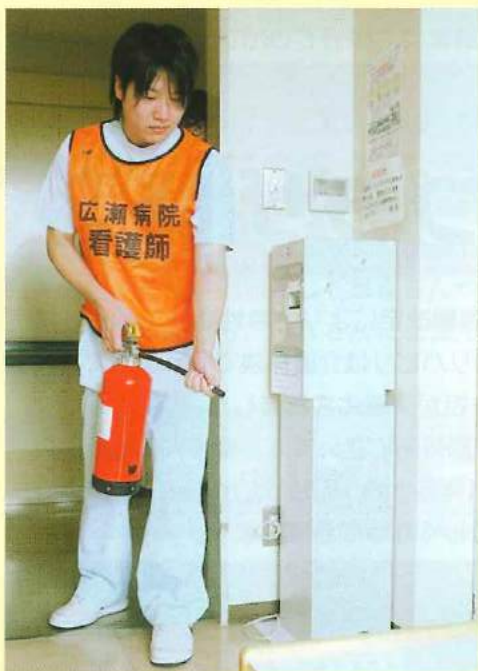
初期消火 出火室の扉を閉める！