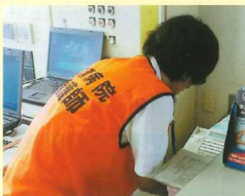
119番通報 他スタッフへの指示