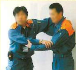
全く歩けない方でも、安定して搬送できます。