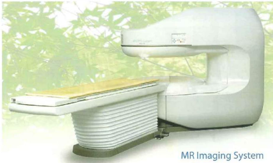
MR Imaging System

当院では平成24年5月にオープンMRI装置AIRIS II 0.3T(日立メディコ社製)から同社のオープンMRI装置では最高機種であるAPERTO Lucent 0.4T に更新しました。