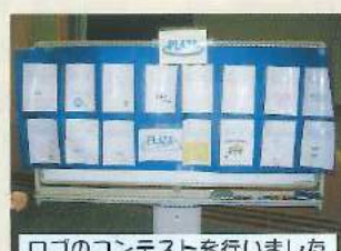
ロゴのコンテストを行いました

患者さんにはご迷惑をおかけしましたが、頭も身体も使って、もりだくさんの内容の研修を職員全体で行うことができました。