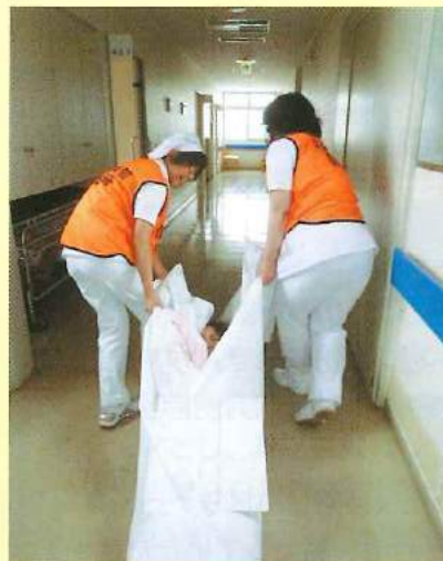
防火扉を閉めて患者さんを安全な場所に誘導 動けない方はシーツに包んで搬送

当日は騒がしくして、患者さんには大変ご迷惑をおかけしました。関係者の皆さま、ありがとうございました。