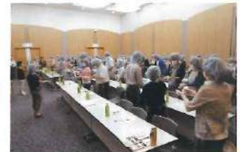
感染を防止するための予防策や嘔吐物の処理方法などを学びました