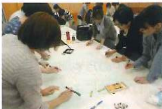
グループワークではマインドマップを作成しました